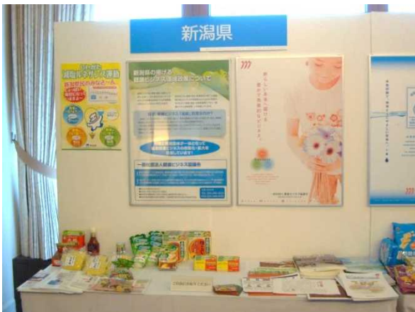
展示ブースイメージ