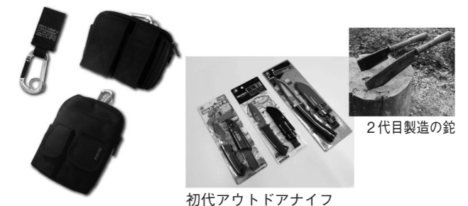
初代アウトドアナイフ